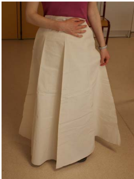
Après le patron, la toile