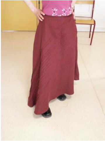
Le modèle terminé