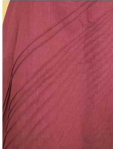
Nervures sur le tissu