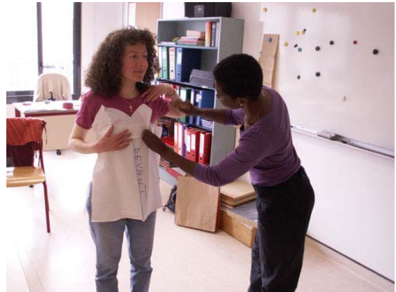
Essayage, retouche de la toile