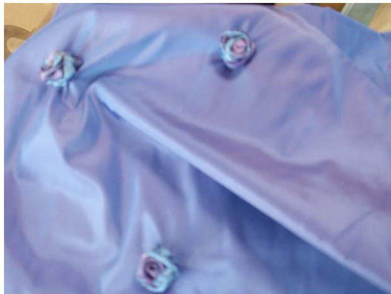
Ornements : la rose en ruban