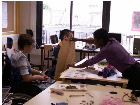
Un autre patron