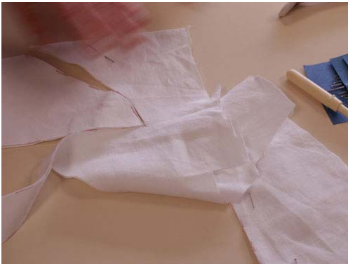
Découpe de la toile pour le petit haut